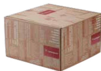
Scatola regalo rossa 40x40x24 cm

Cantucci alle mandorle 200 gr - San Patrignano